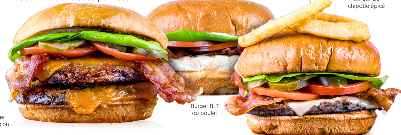
Cheeseburger double au bacon

Deux tacos à coquille molle remplis de salade de chou à la coriandre, de tomates et de poisson légèrement pané, le tout agrémenté de mayonnaise au chipotle. Servis avec des frites et de la salade de chou.