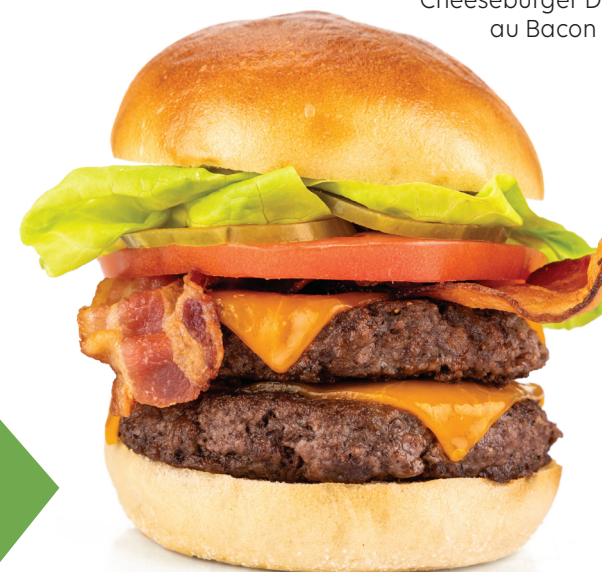
Cheeseburger Double au Bacon

SMASH BURGER 16,69 Galette de bœuf assaisonnée écrasée entre deux tranches épaisses de pain beurré grillé, garnie d'oignons sautés, de mayonnaise, de moutarde et de deux tranches de cheddar.