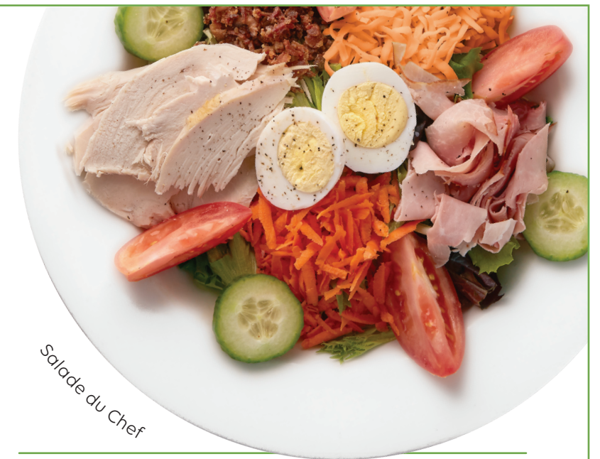
Salade du Chef

Emportez-le! Commandez n'importe lequel de nos plats faits maison à irvingoil.com/ordernow .